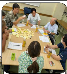
備蓄について水は?