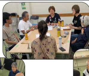
集合場所は? 連絡先は?