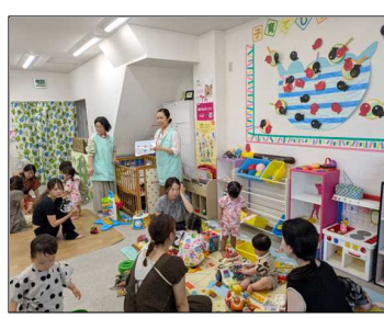
ひろばの中は大賑わい