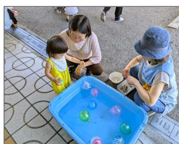
金魚すくいもヨーヨー釣りも難しいねえ

陽だまりは、外で金魚すくいとヨーヨーつりを担当しました。心地よい日陰での水遊びで、ポイを持ったり、釣り針を持ったりちびっ子は初めての体験を楽しみました。