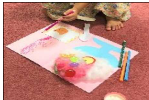
美味しそうなかき氷

三原台子ども園の先生による「むすんでひらいて」と「アンパンマン」の手遊びとかき氷の絵本を見せてもらい、次はみんな楽しんで