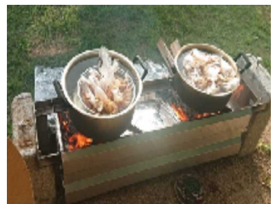
湯せん調理のカレーとご飯