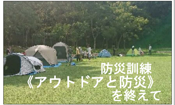
防災訓練 《アウトドアと防災》 を終えて

8月26日(土)27日(日)の2日間、三原公園を利用し、防災のためだけにアウトドアをするのではなく、体験していれば、もし何かが起きた時には役に立つお気軽キャンプチャレンジが始まりました。今回一般参加は3組11人でした。