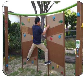
カーブトラバース