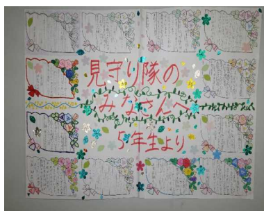
5年生の感謝の言葉 寄せ貼り