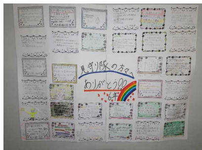
6年生の感謝の言葉 寄せ貼り