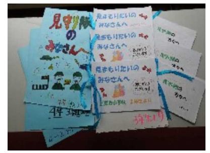
1・2・3・4年生の感謝の小冊子

ただきありがとうございます。1年生〜6年生の代表さんから、感謝の言葉と学年別に手紙や詩集をいただきました。その他の生徒は教室のモニターテレビでこ