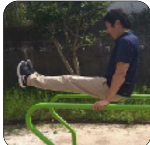
パラレルハンガー

南第4地域 包括支援センター お困りごとなんでも相談室 5月19日(金曜日) 10時～11時 三原台地域会館