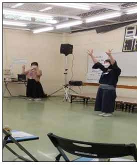
座ったままで音楽に合わせてロコモ体操