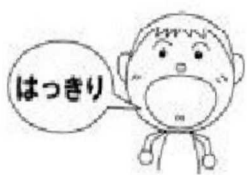
言葉がはっきりする