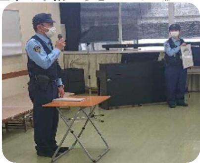
詐欺が増えています。注意喚起