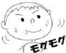
味覚がはっきりする

正しい姿勢でしっかり食べると良いことがいろいろあります。誤嚥で窒息する子どもは、9割が5歳以下の子どもです。子どもの成長に合った食品を選び、モグモグしっかり食べて誤嚥を防ぎましょう。